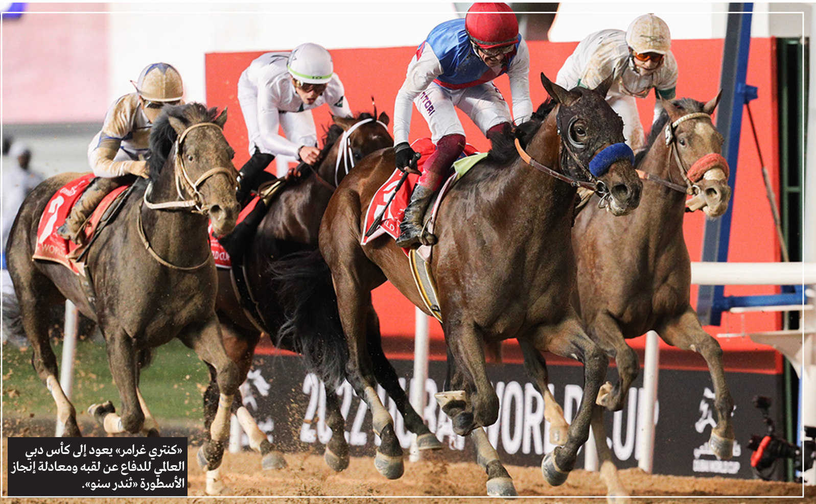
«كنترى غرامر» يعود إلى كأس دبي العالي للدفاع عن لقبه ومعادلة إنجاز الأسطورة «شندر سنو».